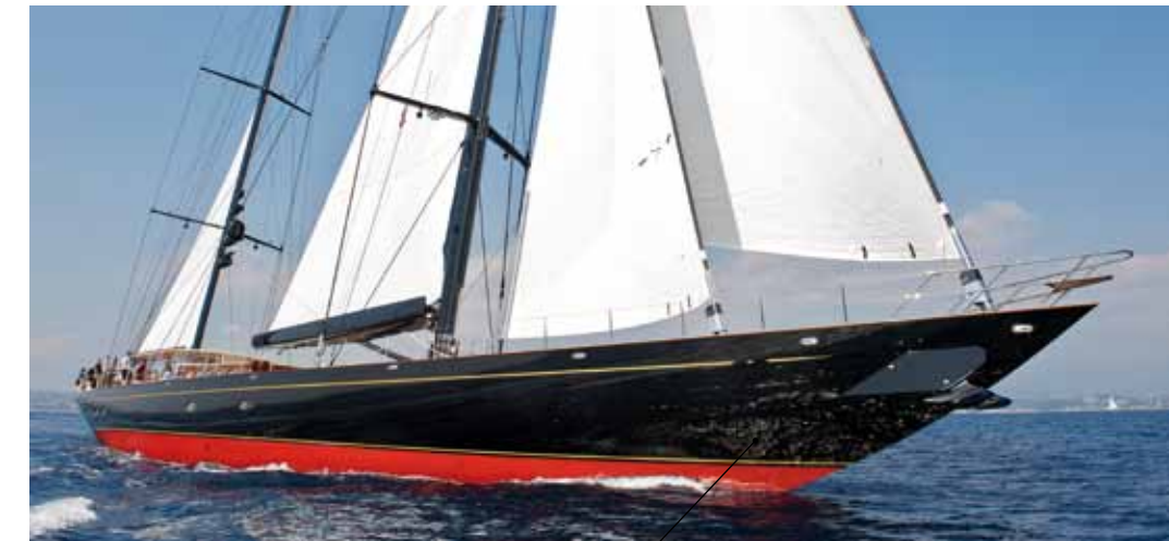
Gli alberi di Marie sono in fibra di carbonio alto modulo e sono stati realizzati da Southern Spars. Sopra, layout e piano velico / The masts of Marie are in high-module carbon fibre and were created by Southern Spars. Above: the layout and sail plan