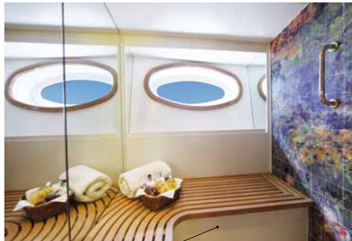
L'hammam nella suite dell'armatore. A destra, il living all'aperto protetto dal grande bimini / The hammam in the owner's suite. Right: the al fresco living area protected by the large bimini top